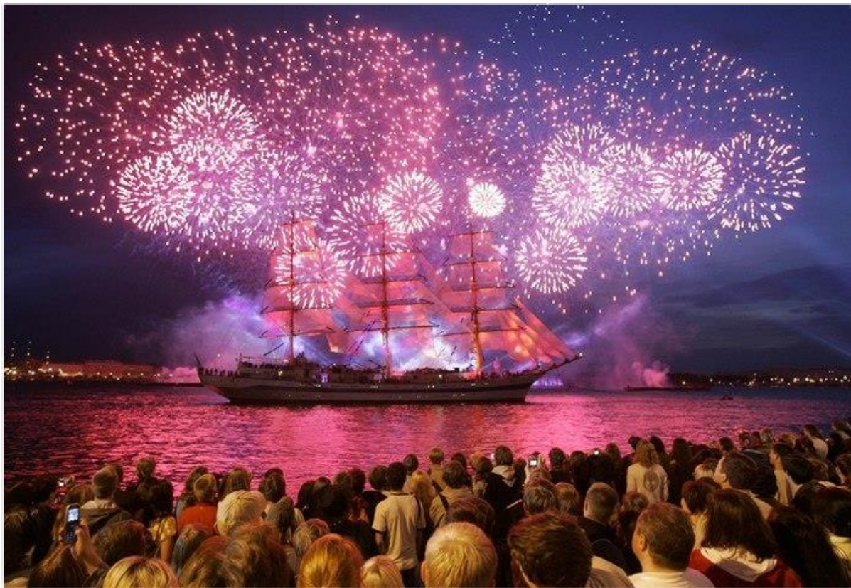
Celebrações de verão na Cidade de São Petersburgo

Viajar ao exterior para estudar é uma decisão que requer muita análise, sobre tudo, pessoal.