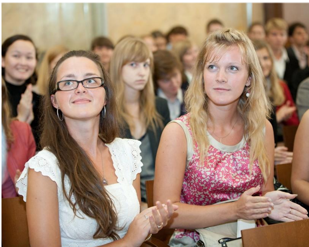
Jóvens estudantes da Universidade Politécnica de São Petersburgo (SPbGPU)

Tratando das questões do Idioma Russo ,não há necessidade de se ter conhecimento prévio pois ,como foi mencionado em linhas acima, a Universidade outorga um Programa Integral de aprendizado do Idioma nas faculdades preparatórias de Idioma (FI).