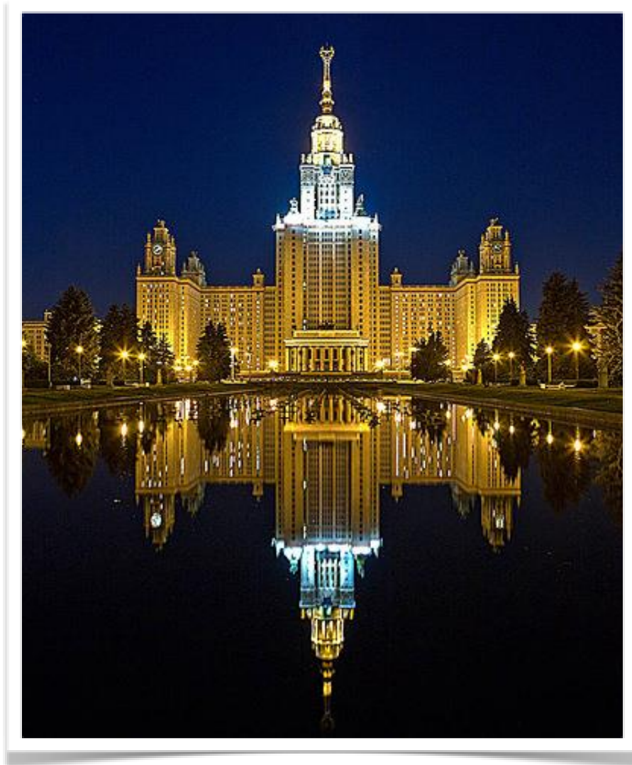
Vista de la Universidad Estatal de Moscóu “Lomonósov” (MSU)

Sabemos o quanto é desconcertante conseguir terminar o ensino médio e não saber que decisão tomar e como escolher uma carreira. A mesma situação se apresenta para os que concluíram a graduação e devem fazer a escolha que definirá o êxito ou o fracasso de seu futuro.