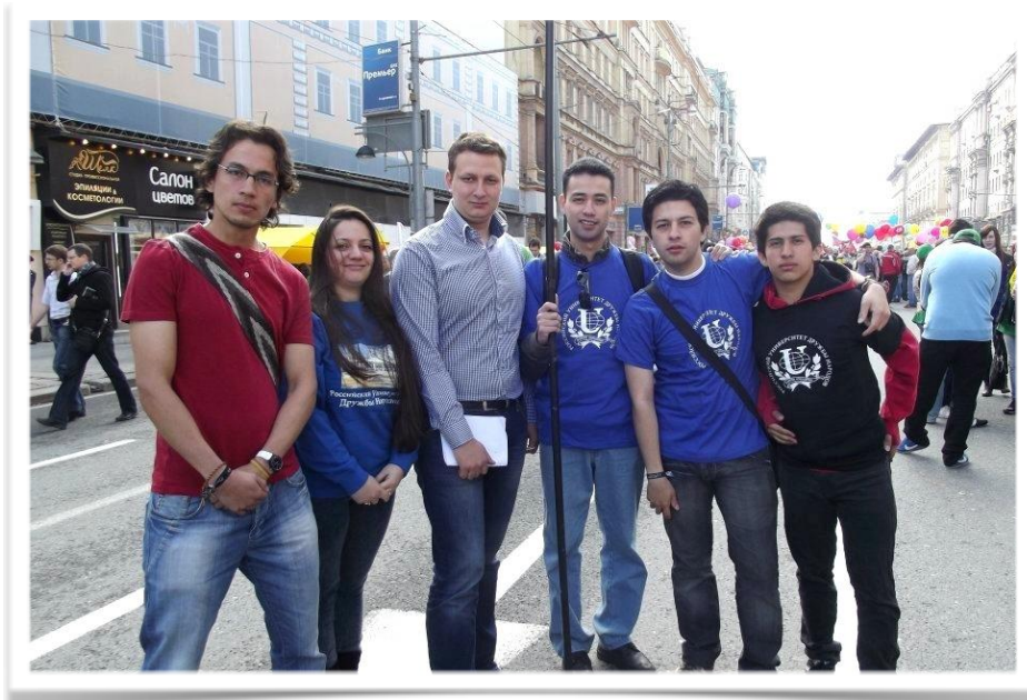
Estudantes latino-americanos da Universidade Russa da Amizade dos Povos (RUDN) durante um evento universitário nas ruas de Moscou

Resulta ser revelador para muitos as grandes facilidades que a Rússia oferece para os estudantes e profissionais Latino-americanos, acostumados a encontrar muitas dificuldades quando se trata de optar por uma vida no exterior.