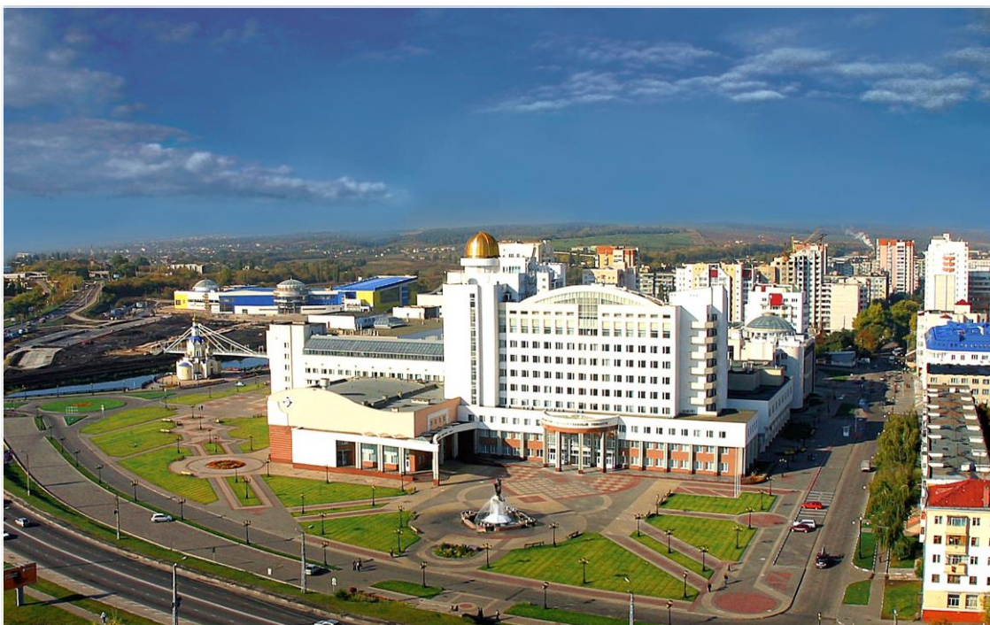
Complejo universitario de la Universidad Estatal de Bélgorod (BelGU)

A Rússia oferece os seguintes tipos de estudos Universitários: